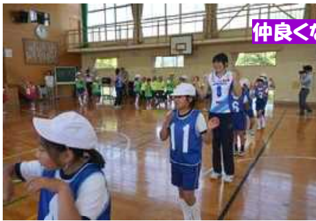
仲良くなるために一緒にダンス!