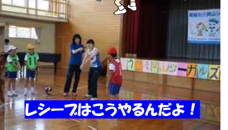
レシーフはこうやるんだよ!