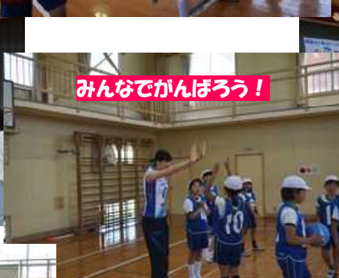
みんなでがんばろう!